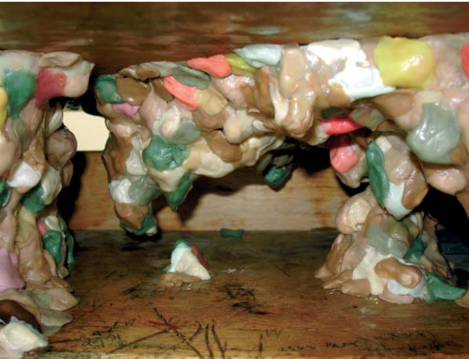
Titelseite und U2: Alexis Dworsky, Arbeit aus dem Ersten Staatsexamen an der AdBK München 2005